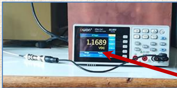
Рис. 3. Мультиметр XDM-1041 измерителя ИГЭД-2L с кабелем (показание при работе лазера = 1,1689 V ).

Датчик измерителя подключен к мультиметру OWON XDM-1041 со встроенным аккумуляторным питанием (рис. 2).