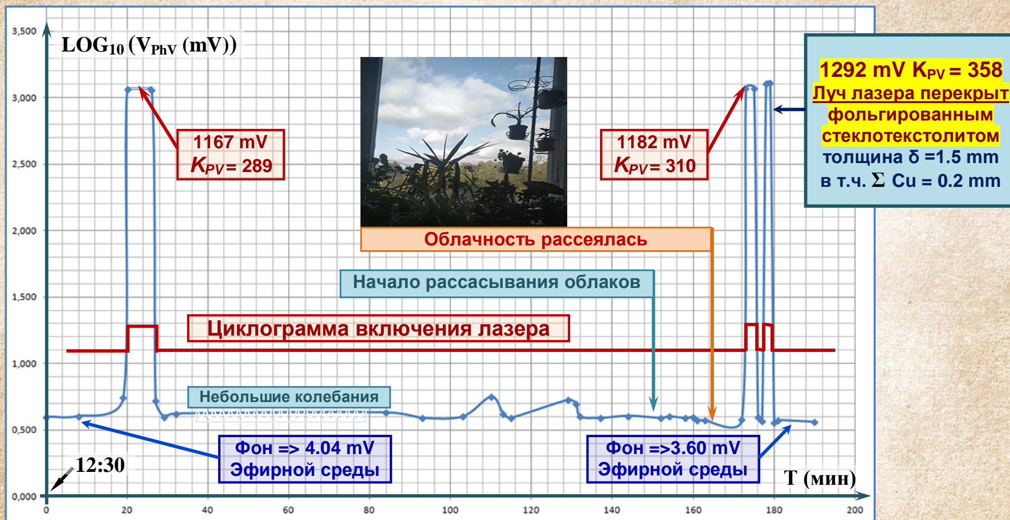
Рис. 4. График зависимости излучения He-Ne лазера от цикла включения и погодных условий внешней среды.

На рис.4. представлен график показаний измерителя ИГЭД-2L с датчиком измерения колебаний эфирной среды на воду, находящейся под действием He-Ne лазера. K_{PV} - коэффициент превышения излучения фонового значения.