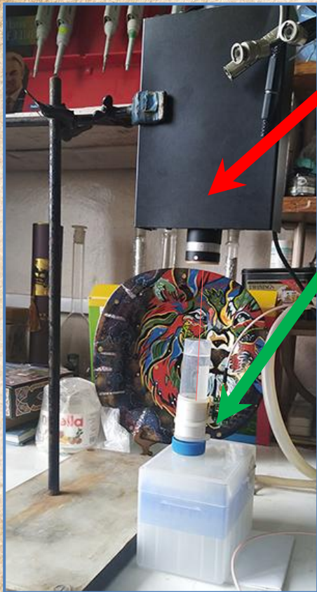
Рис. 1. Лазер с датчиком.

Предметом исследования и измерений является неизвестное “странное излучение” He-Ne газового лазера, накачка которого производится электрическим разрядом в смеси газов под давлением 2.5 mm Hg (2.5 Torr) .