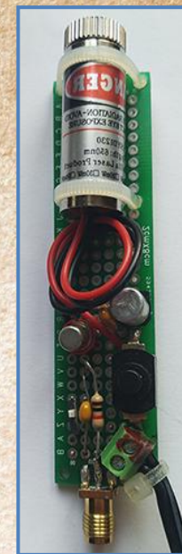
Рис. 5. Лазерный п/п излучатель.

В этом излучение п/п лазера принципиально отличается от газоразрядного лазера, у которого неизвестное “ странное излучение ” имеет K рV , превышающее фоновое среды в ~ 300 раз !!